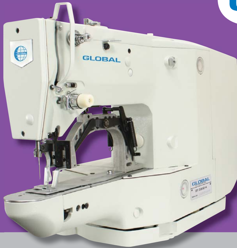
BT 2900 H